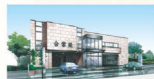
守山合掌殿 (第1ホール・第2ホール) 名古屋市守山区町南8-6

1級葬祭ディレクター（厚生労働省認定・葬祭ディレクター技能審査）の資格を持つスタッフがお客様のご希望に沿った葬儀ができるようにご提案させていただきます。