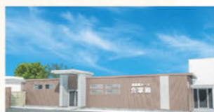
清須合掌殿 清須市西田中本城50