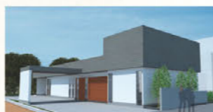
小幡中合掌殿 名古屋市守山区小幡中2-24-25