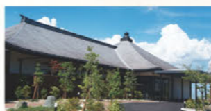
良福寺会館(本館・別館) 尾張旭市印場元町1-15-19