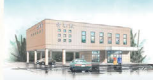
にし合掌殿 名古屋市西区名西1-24-16