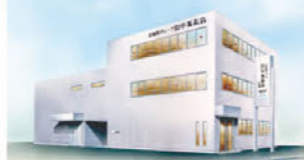
たなか 名古屋市守山区新城9-12