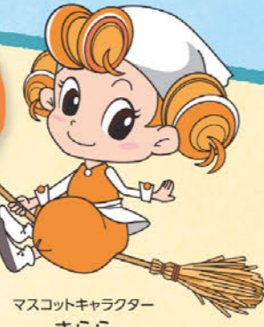
マスコットキャラクター きらら